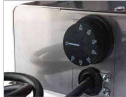
FIGURA / FIGURE B